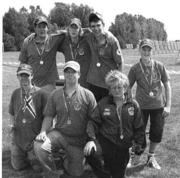
God medaljehøst for ungdommene fra Hvaler under årets NUM.

Noen av skytterne var overhodet ikke fornøyde med dagens skyting. Det er bare å innse at ikke alle dager er like. Noen dager holder det, andre dager ikke.