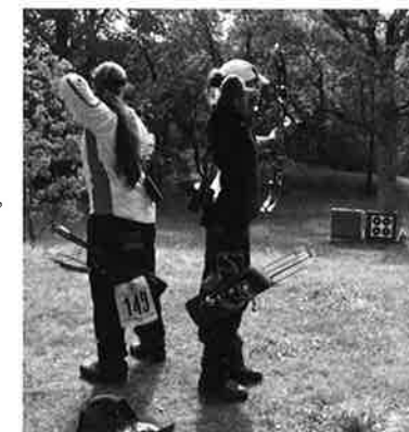
Fra VM i Felt i Göteborg i 2006

Som vanlig kjemper damene om Kongepokal, mens Herrenes compoundklasse skyter om NBF's Pokal – i likhet med Compound Herrer jr. Dessverre er det ikke nok deltakere i Damer Compound jr. til at det settes opp NBF's Pokal.