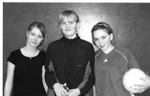
Her er jentene som går foran.....

Onsdag trener 10-åringene og minijr. Ei økt før de eldste skyter. Denne kvelden prioriteres korthold, teknikk etc.