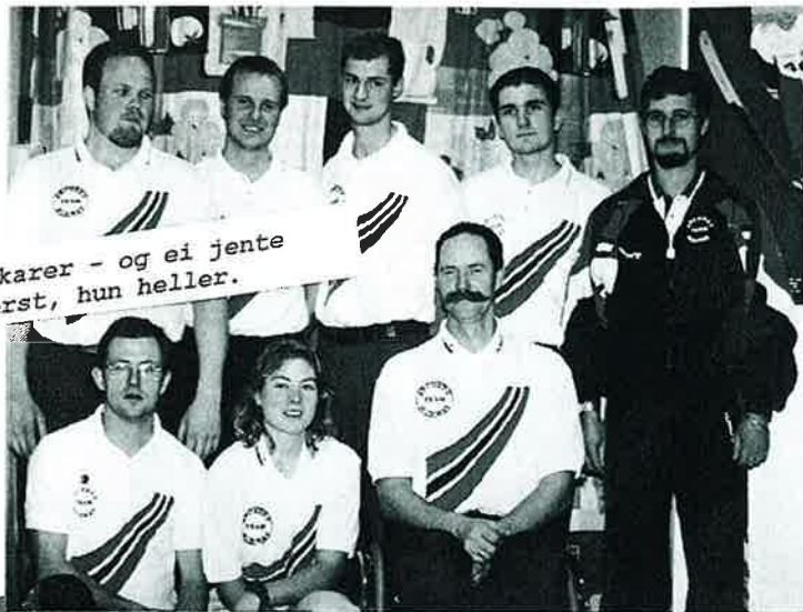
Store, sterke karer - og ei jente som ikke er verst, hun heller.