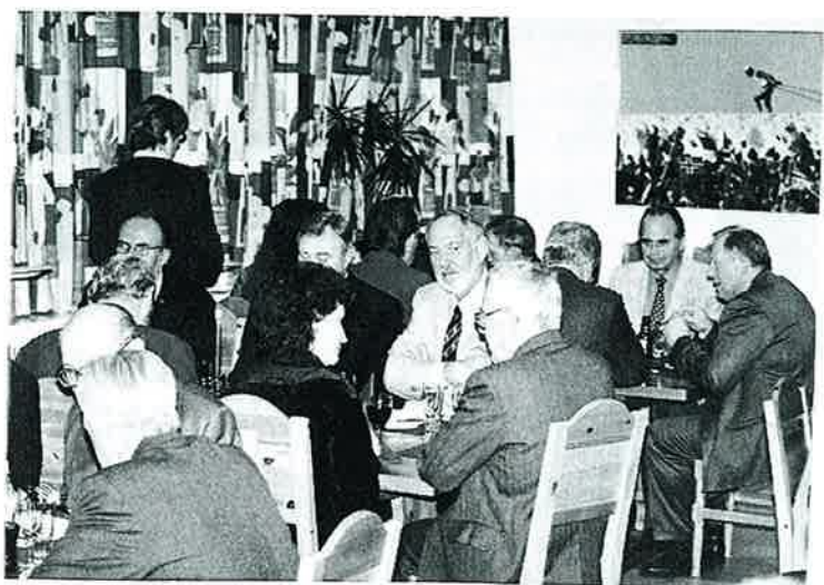
Toppidrettssenterets nye kafeteria ga en fin ramme rundt "koldtbordet"