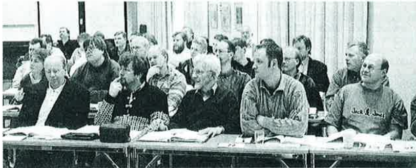
Tingrepresentanter i dyp konsentrasjon

ut på stevneavgift gjennom kr. 20,- pr. start. Dermed skremmer man ikke bort dem som deltar sporadisk, ved en høy «inngangsbillett», samtidig som de som deltar mest, betaler mest. Et annet moment i denne forbindelsen var at Tinget ønskes at stevneavgiften i all hovedsak skal tilbakeføres de kretser hvor dette erlegges. Hvordan dette skal gjøres, blir opp til Forbundsstyret å klar- gjøre - da det vil være et behov for et visst beløp til sentral stimulering av «svake ledd».