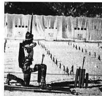
En fin representant for et godt fransk damelag - her i knestående.....

De beste Italienerne brukte ca. 11 minutter på 4 km skigåing i stafetten. Det er nesten like fort som Bjørn Dæhlie. De var ikke så treffsikre, men traff likevel en gang i blant - og det holdt så lenge de kan gå en strafferunde fortere enn det enkelte bueskyttere brukte pr. pil på standplass. Så her er det en balansegang som kombinerer såvel skiteknikk, skyteteknikk og standplasseknikk.