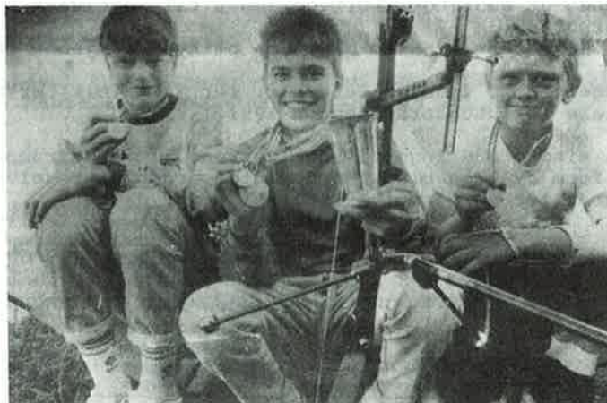
En glad gjeng fra Aktivitus IF etter NM Skive 1990