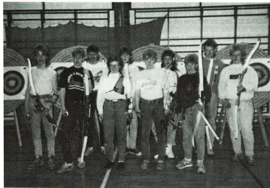
Deltakerne på juniorsamlingen i Trondheim