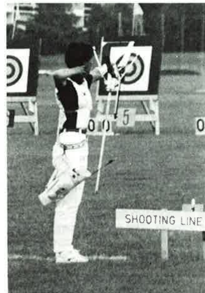
Bueskytterdronningen Soo Nyung Kim i aksjon